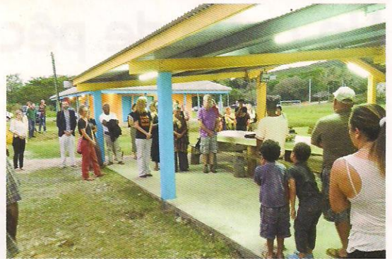
A Bayes, la consule d'Australie a présenté le documentaire sur les aborigènes, "Murundak, songs of Freedom".

Dans la sélection « Films du Pacifique », retenons que le prix Nouvelle-Calédonie 1 ère a été réservé à « Imulal » de Nunë Luepack (France).