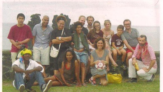
Une dizaine de réalisateurs français et étrangers ont participé à cette édition du festival.