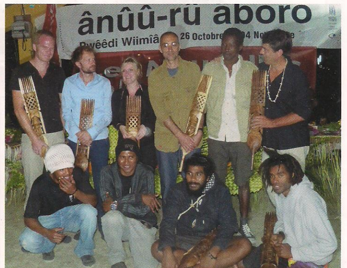
Une photo pour réunir les réalisateurs récompensés.